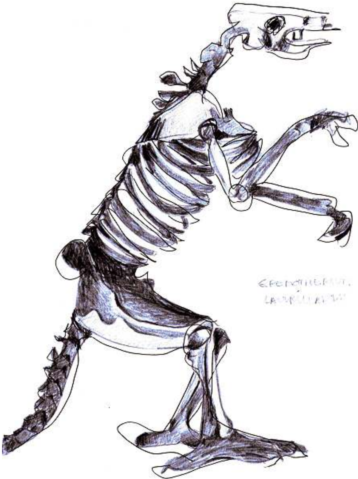
Desenho Ana Sevla